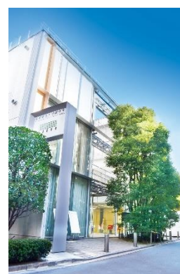
事業構想大学院大学 東京校舎・外観

2012年に開学した、日本で初めての「事業構想」と「構想計画」を研究する実践教育機関。事業の根本からアイデアを発想し、理想となる事業構想を構築し実現可能な構想計画にまとめ、社会に広めることまでを想定した体系的な教育カリキュラムとして展開している。社会変化や技術・医療の進歩などの観点から未来社会を洞察して、気付いていける、真の課題を発見する素養を身につけていく社会科学的な科目群を用意。現在、あるいは未来社会の想定される課題から事業の種を探し、自社の経営資源を活用し、独自性、持続性のある事業をつくっていくことを大きな特長としている。