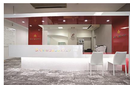
Chukai コムコムスクエア 受付

2021年にオープンした鳥取県米子市の文化交流・発信拠点「Chukai コムコムスクエア」の運営を行う中海テレビ放送内の部署。「人がつながる。心と体が健康になる。人生が豊かになる場所。」をコンセプトに教養・趣味・健康などさまざまなカルチャー講座を展開している。