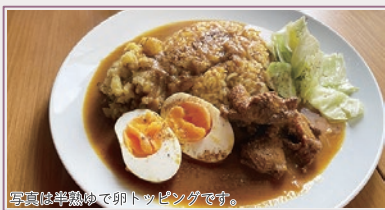
写真は半鍋で卵トッピングです。

米子市 10月 OPEN スパイスの香りがやみつきカレー spice curry ガンダーラ