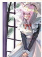
お帰りなさいませ、ポッチやま