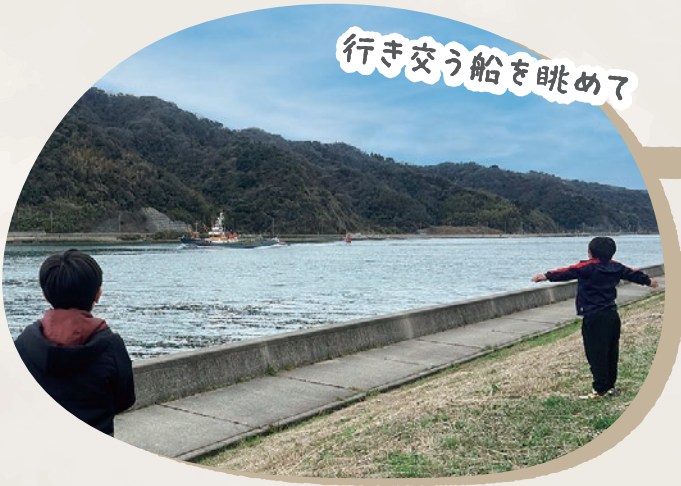
行き交う船を眺めて