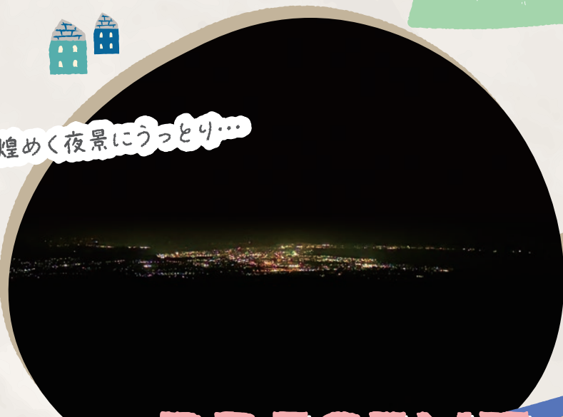
煌めく夜景にうっとり...