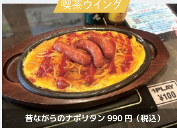
喫茶ウイング 昔ながらのナポリタン 990円(税込) ゲーム筐体とナポリタンにキュン♡

今月もまだまだ紹介し足りない！弥生時代にタイムスリップした気持ちになったり、探し求めていた昔ながらのナポリタンに出会ったり……。いろんなところに行く楽しさを 実感した号になりました。