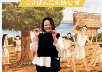
むきばんだ史跡公園 ずっしりとした石のネックレスを試着

コムコムマガジンは米子コンテンツ工場(米子コン)が制作しています。米子コンは、デジタルハリウッドSTUDIO米子(STUDIO米子)を卒業したクリエイターチームです。