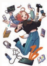
CBMメインビジュアル