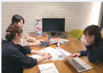
アンケートを元に企画会議

アンケートは、みなさんの状況も知ることができ、制作時にとても役立っています。これからも情報のキャッチボールを楽しみにしてきますね。地元ならではの良いところをたくさん伝えていきたいと思えます！