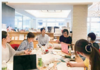
取材・編集を経てみなさんの元へ

コムコムマガジンは米子コンテンツ工場（米コン）が制作しています。米コンは、デジタルハリウッド STUDIO 米子（STUDIO 米子）を卒業したクリエイターチームです。