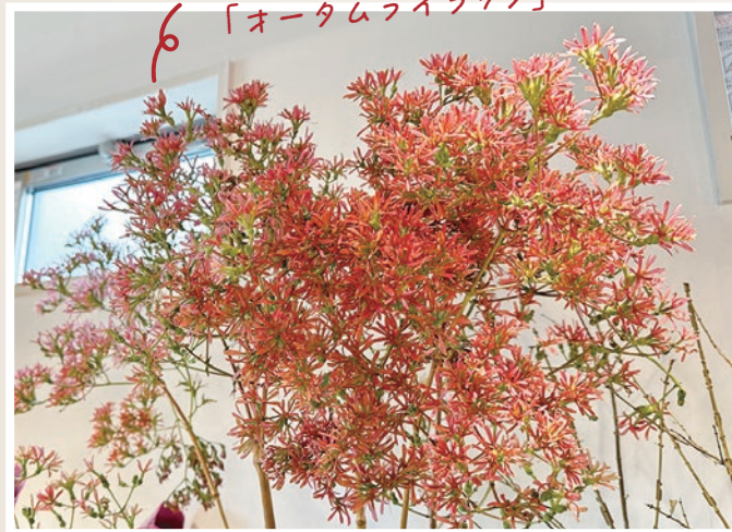
甘いバニラの香りがして、見た目も部屋の香りも華やかになります。