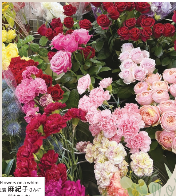
Flowers on a whim 代表 麻紀子さんに 聞きました!