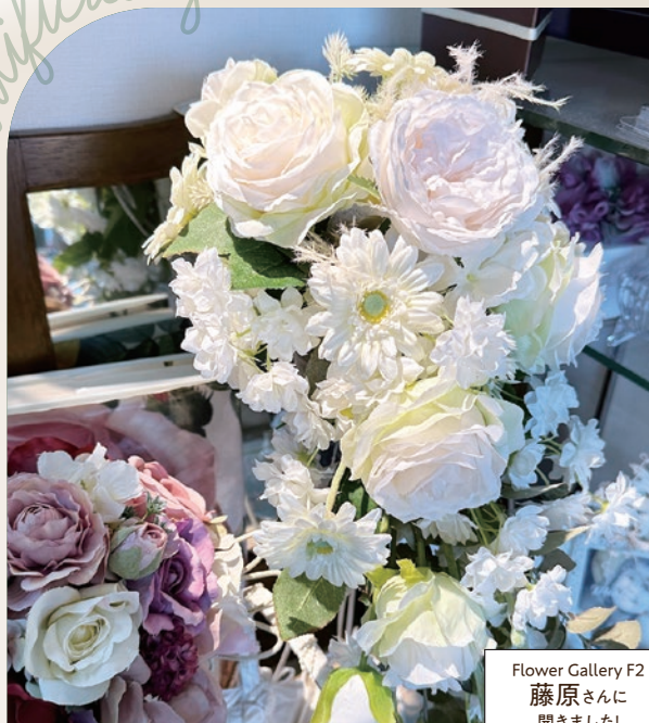
Flower Gallery F2 藤原さんに 聞きました!