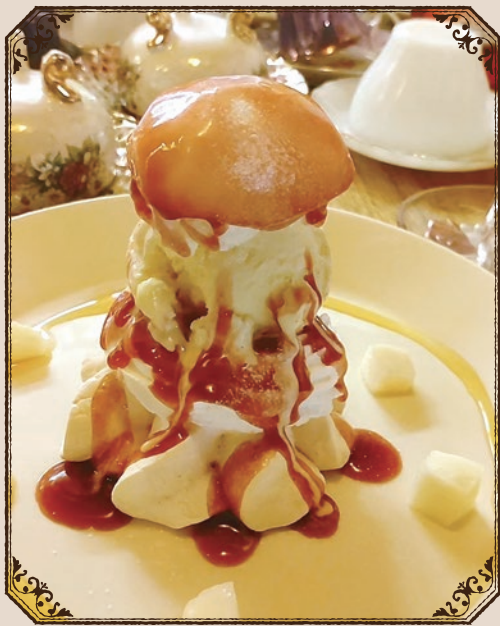
焼いたメレンゲにホイップやフルーツを飾ったスイーツ「パブロバ」。