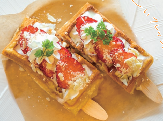
スティックワッフル 練乳いちご 450円