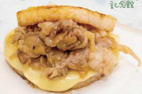
鳥取和牛ライスバーガー チーズ入り 680円