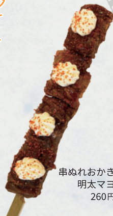
串ぬれおかき 明太マヨ 260円