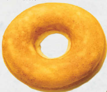
とうふ焼きドーナツ プレーン 170円