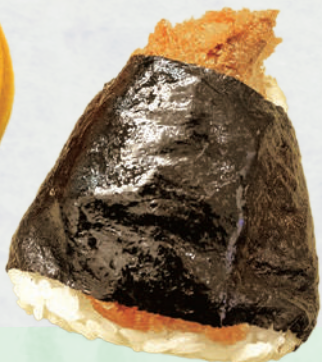
おにぎり 境産アジフライ 190円