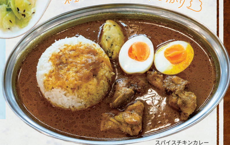
スパイスチキンカレー 980円 (ゆで卵トッピング +110円)