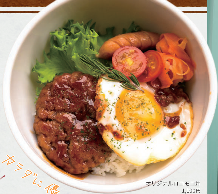
オリジナルロコモコ丼 1,100円

📍 米子市日野町57 大塚ビル1F ☎ 070-1890-9926 🕒 11:30~15:00 📅 土曜 📱 @_cafealo