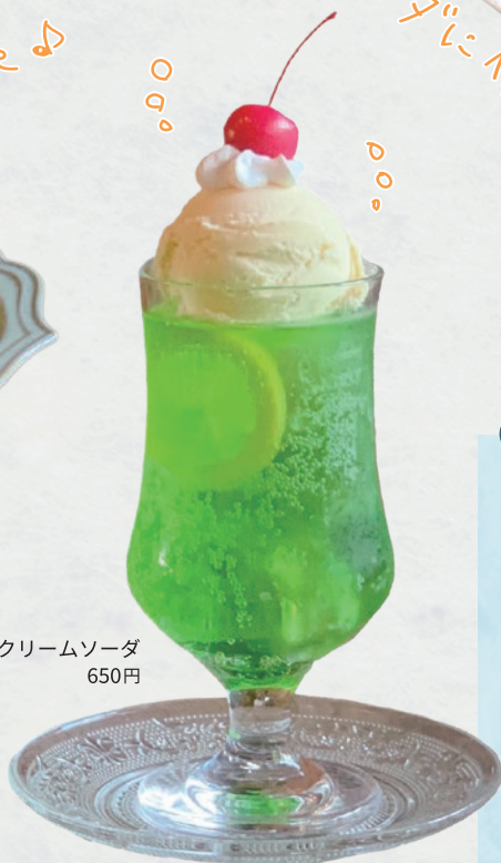
メロンクリームソーダ 650円