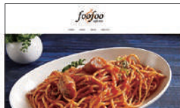
▲自主制作 (HP制作)：架空サイト「カフェレスト fofojo」のHP