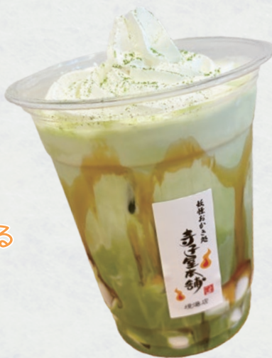
わらび餅抹茶ラテ 650円

☎ 境港市松ヶ枝町23 🕒 10:00~17:00 (店内飲食 L.O.16:30) 📅 水曜 (祝日の場合別日代休) 📧 @kogane.terrace_atelier