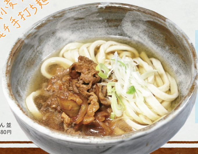
肉うどん 並 580円