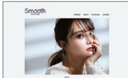
▲卒業制作 (HP制作)：架空サイト「Hair & make Smooth」のHP