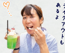
テイクアウトも あるよ

📍 米子市日野町7番地 🕒 10:00~20:00 📅 不定休 📱 @goods_cafe_mix