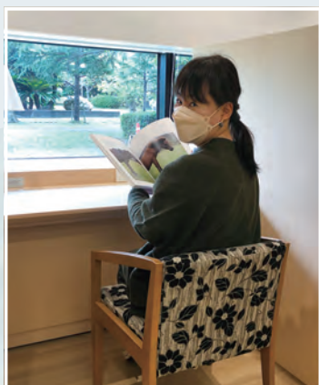
予約制の閲覧席。電源もあります。