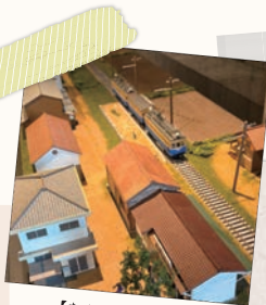
【なんぶふれあい館】 まるで本物のような、 法勝寺電車のジオラマ

もともと本が好きでなコママガ編集部。従来の「借りて帰るだけ」の図書館しか知らず、こんなに充実のサービスがあったとは！と目からウロコ。早く利用したくて、テンションが上がりました。リモート作業が多い私達には、コワーキングスペースの充実度は嬉しい限り。両館にカフェも併設されているので、無限に滞在できちゃいます。