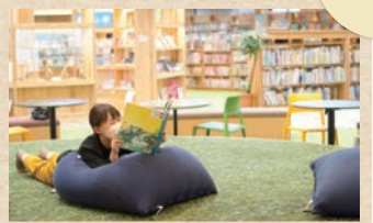
【法勝寺図書館】 図書館でこんなにくつろいだのは初めて！