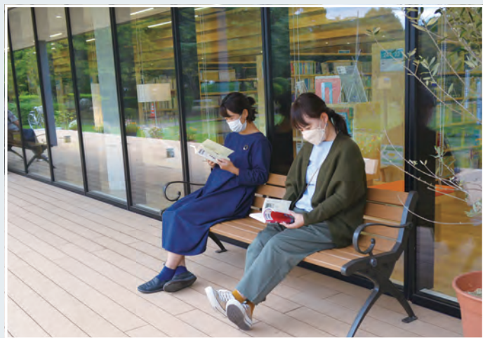
晴れた日はテラスのウッドデッキ席を開放しています。秋風を感じながらの読書は心地いい〜♪