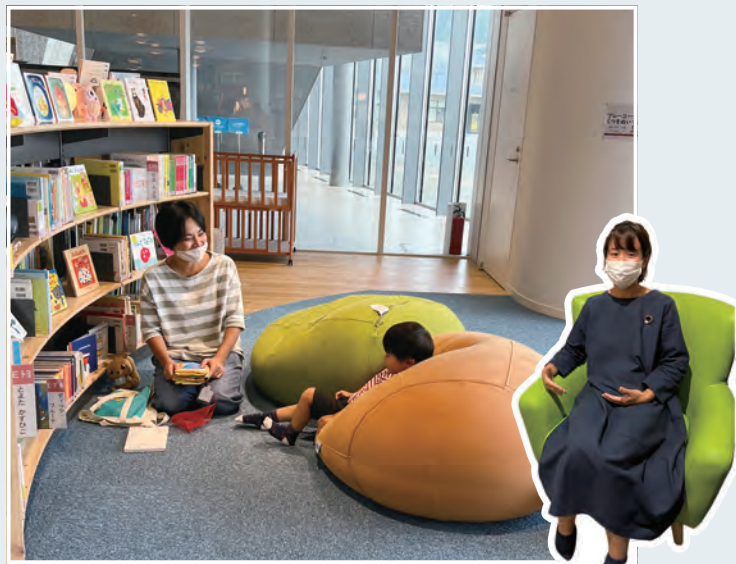
(上) 子育て世代も読書を楽しめる！プレーコーナー。(右) 授乳部屋の椅子。授乳室の設備は、授乳部屋、長椅子、子ども用トイレ(小便器・洋式)、お湯も出る流し場、おむつ交換台、ゴミ袋設置など。

「赤ちゃんからお年寄り、子育て世代、障がい者、LGBT、外国人等、全ての人が快適に安心して利用できるサービスと場所づくりの推進」が目的のひとつである図書館。それゆえにさまざまな工夫がありました！