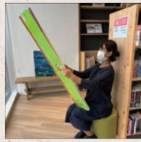
【境港市民図書館】 Bigサイズの絵本を発見♪